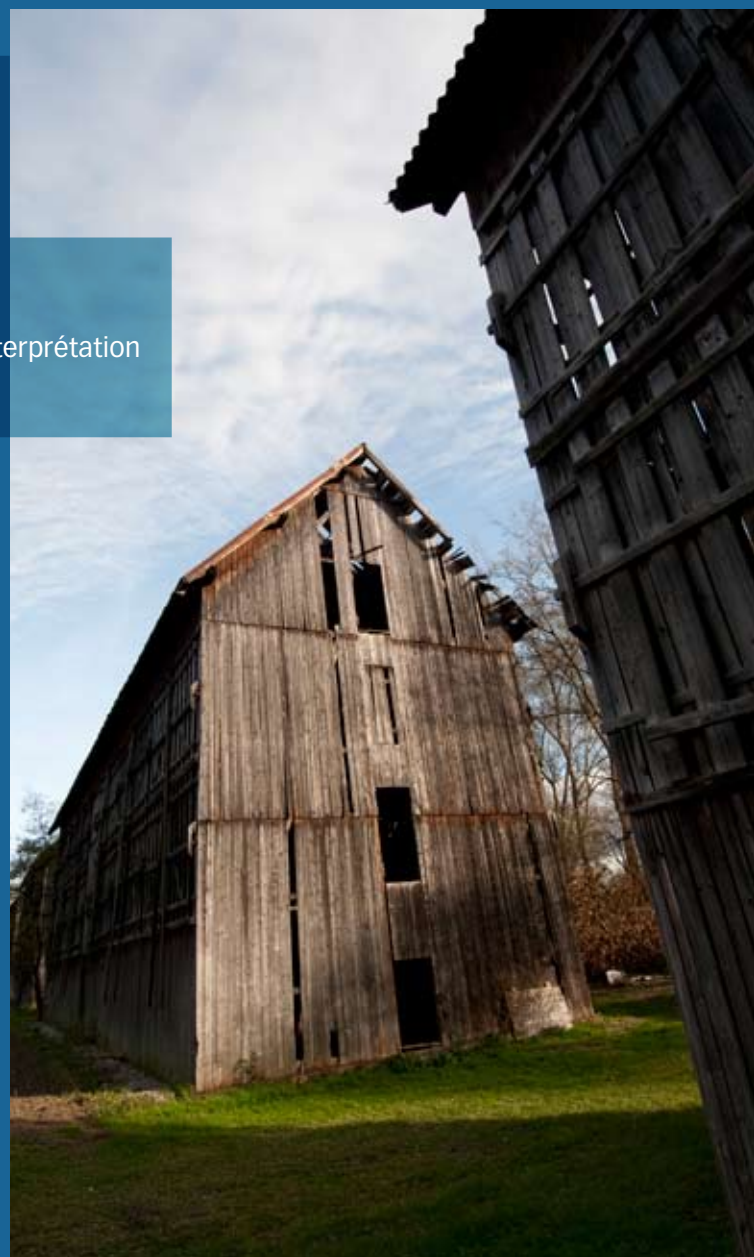
↳ Un séchoir à tabac sur le sentier de Guémar

Alors que plusieurs communes ont l'ambition de se lancer dans la création de sentiers d'interprétation, la Communauté de Communes a décidé de réaliser une étude préalable. Le but : harmoniser les démarches et favoriser la complémentarité des projets en évitant les répétitions thématiques. L'étude a été menée par la Maison de la Nature du Ried et de l'Alsace Centrale qui a consulté les communes avant d'élaborer un plan d'interprétation basé sur les projets de communes ou les potentialités identifiées sur chaque site. A l'image de Bergheim et St-Hippolyte, cette approche collective peut donner lieu à des projets partagés.