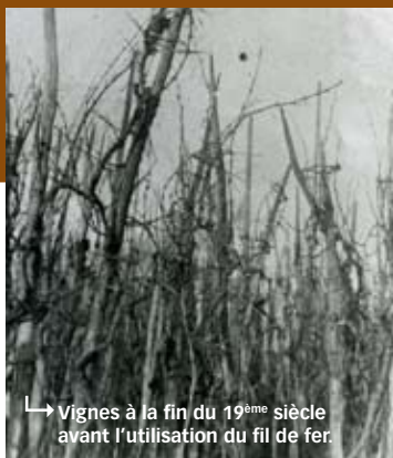
↳ Vignes à la fin du 19 ème siècle avant l'utilisation du fil de fer.