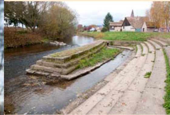
↳ Le lavoire de Guémar

paysages à travers les âges, la formation, l'impact et l'écosystème d'une gravière, l'exploitation d'un fossé pour son sable, la protection des espèces animales et végétales qui peuplent les prairies humides, la qualité de la nappe souterraine, l'activité du moulin de St-Hippolyte et le rituel des fenaisons supplanté aujourd'hui par la culture du maïs. Le sentier sera inauguré au printemps 2011. ▲