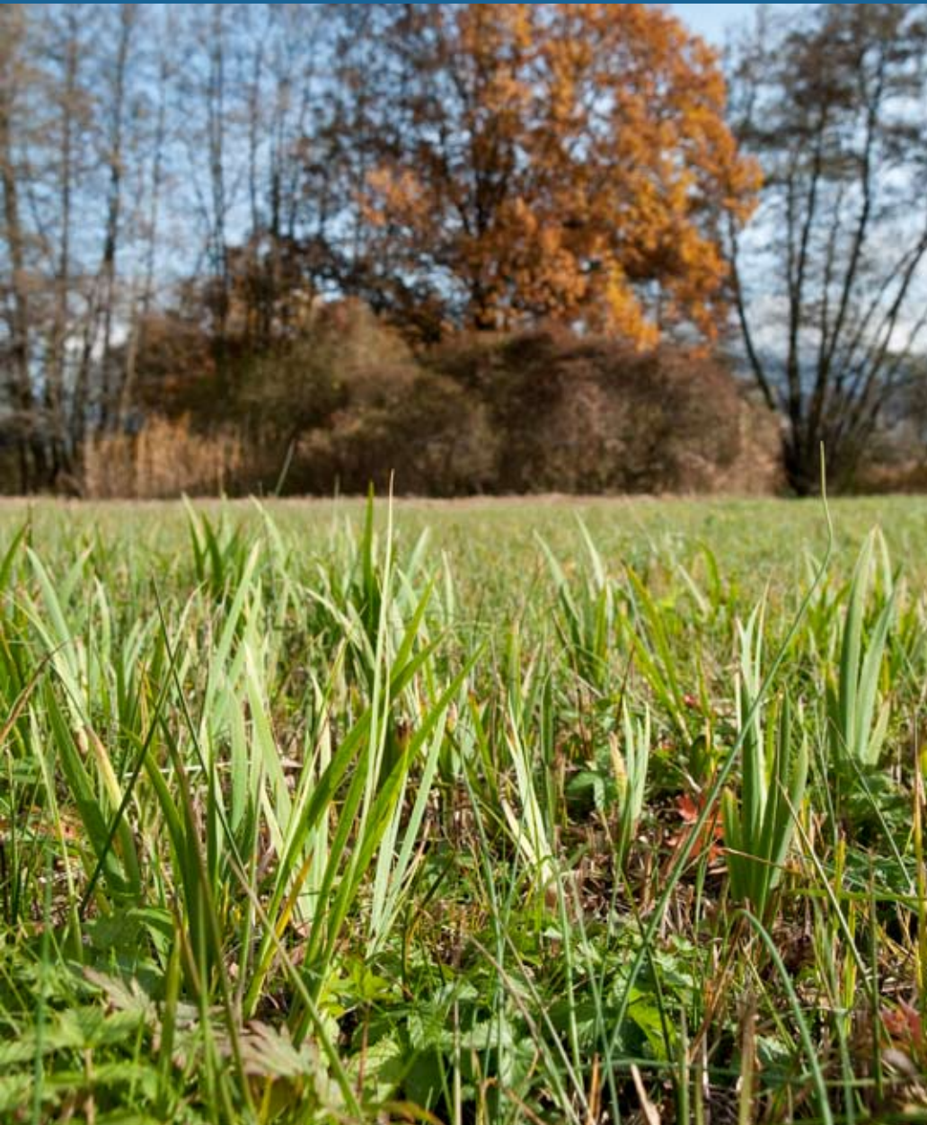
↳ Prairie humide préservée par le Conservatoire des Sites Alsasiens (CSA)